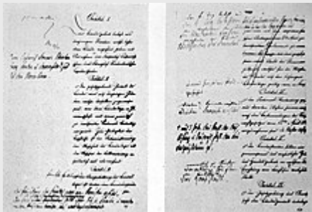
Entwurf für die Norddeutsche Bundesverfassung, 1866